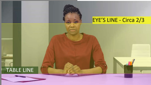
EYE'S LINE - Circa 2/3